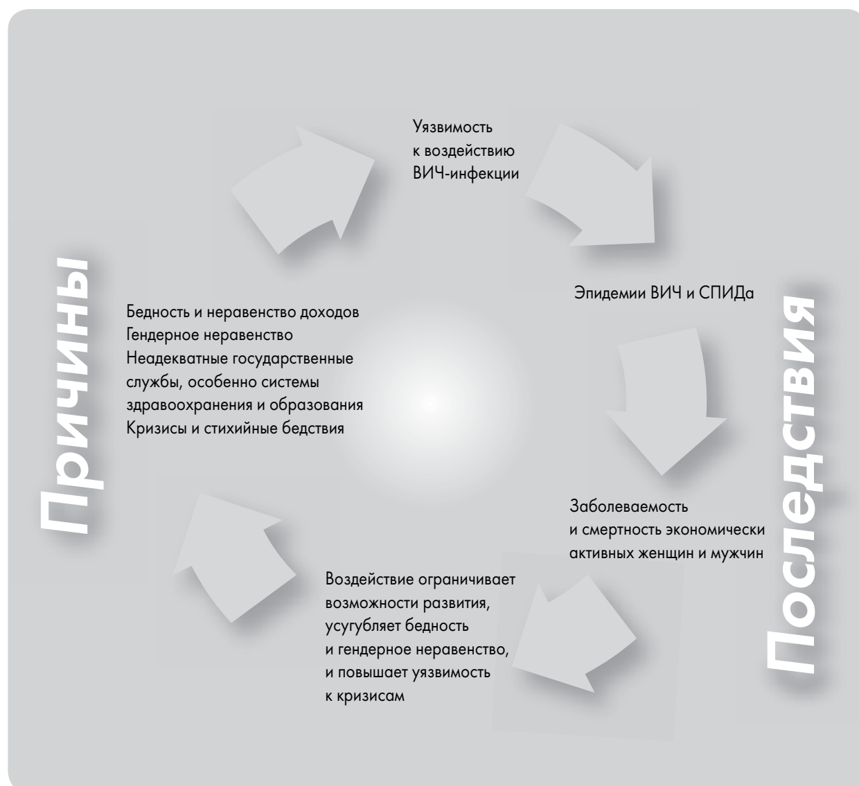
Диаграмма приводится из публикации Mainstreaming HIV/AIDS in Development and Humanitarian Programmes , Sue Holden, Oxfam Publishing, 2004.

Эпидемии ВИЧ и СПИДа имеет разрушительные и далеко идущие последствия для отдельных лиц, семей, сообществ и общества. Эпидемически они не являются каким-то новым явлением, но эпидемии ВИЧ и СПИДа отличается от всех других эпидемий своим беспрецедентным негативным воздействием на социально-экономическое развитие целых государств, наиболее затронутых этой проблемой. В странах с высокими показателями распространения ВИЧ квалифицированный персонал в государственных, социальных, образовательных и медицинских учреждениях заболевает и умирает, подрывая потенциал этих учреждений по оказанию услуг с целью удовлетворения потреб-